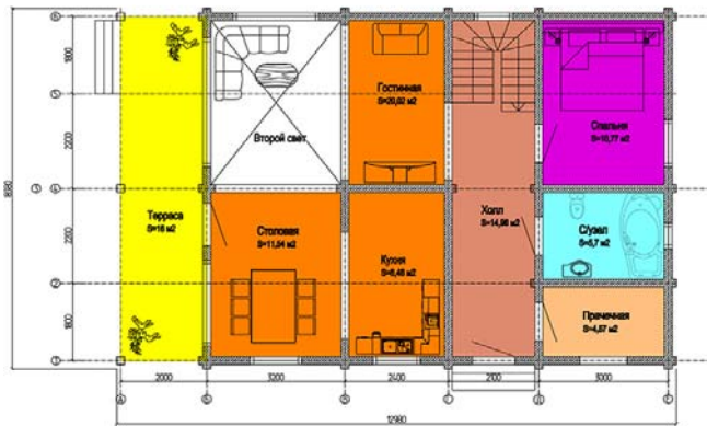
План 2 – го этажа